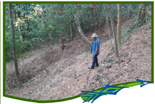
Terreno de la Unidad Demostrativa de Apicultura

Izquierda. Terreno en condiciones iniciales.